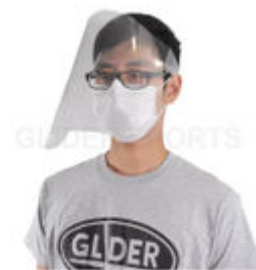
フェイスシールド F