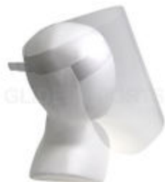
フェイスシールド G