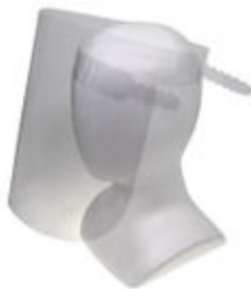
フェイスシールド