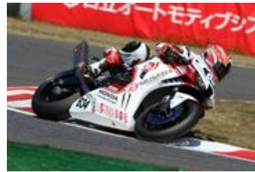
名越 哲平 アウトサイド