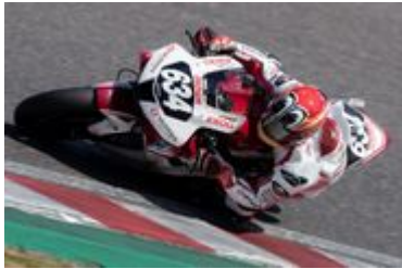
名越 哲平 インサイド