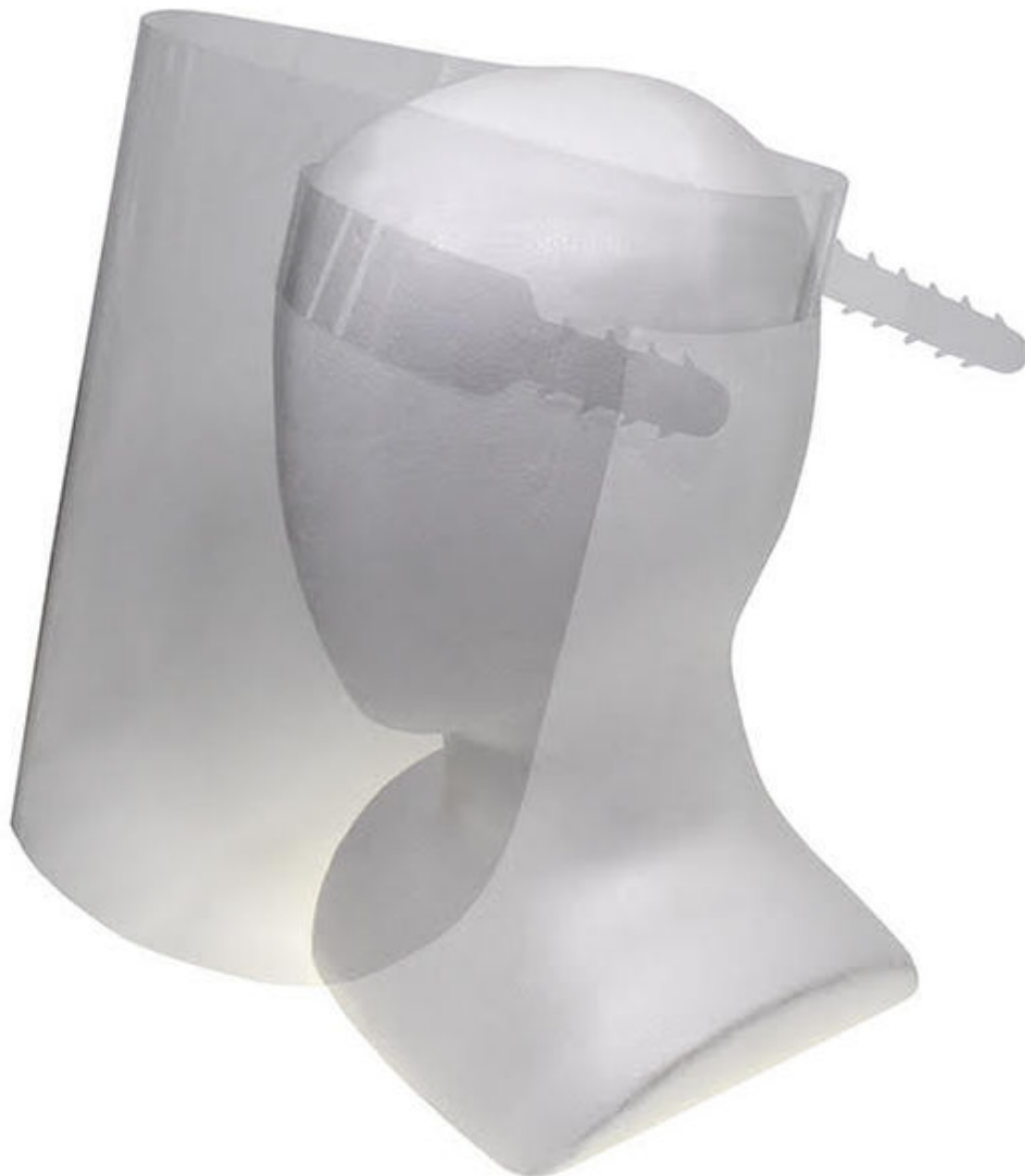
フェイスシールド