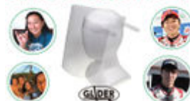
フェイスシールドを送ろう