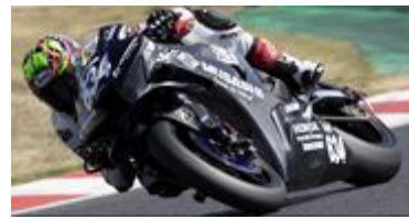
水野 涼 3