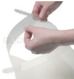
フェイスシールド E